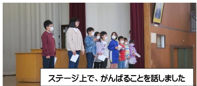
ステージ上で、がんばることを話しました