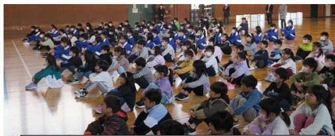
聞いている皆さんの姿勢と目もすばらしかったです