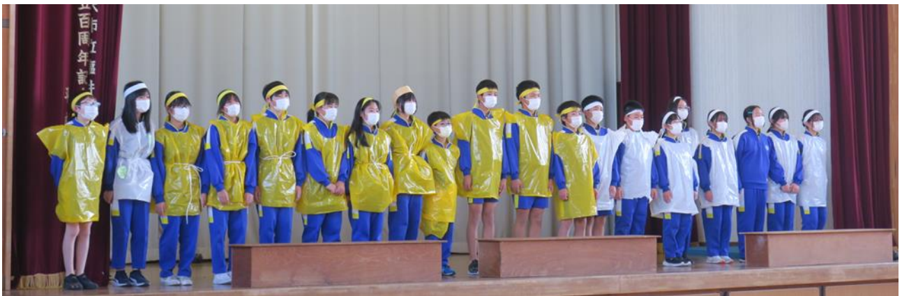
〈6年生の歌『ふるさと』 劇の内容にも合っていて、歌詞の言葉が胸に響きました〉

11月9日(水)に、学習発表会を実施しました。日頃の授業で学んだことを、詩、歌、劇、ダンス、運動技など、さまざまな方法で発表しました。各学年の持ち味が表れた見ごたえのある発表でした。発表を見ながら、4月からこれまで、各学年がどのような学習を積み重ねてきたのか思い出されました。そして、各学年の子ども達の成長を感じました。一生懸命に発表する子どもたちと、一生懸命に見ている子どもたち。その両方があったからこそ、素晴らしい学習発表会になったのだと感じました。学習発表会を通して、気づいたこと、感じたこと、学んだことを、これからの授業でも活かしてくれると思います。子どもたちへの温かい応援、ありがとうございました。