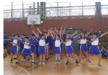
<プール開き：5年生の決意発表>