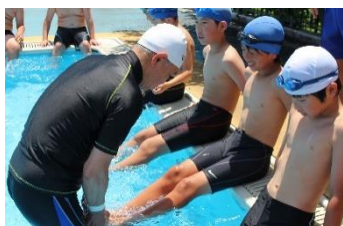
<平泳ぎのかき足を講師の先生から習う>