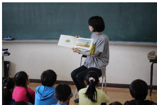
金曜日の朝の豊かな時間です