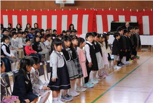
緊張しながらも元気いっぱいの一年生

4月7日に新入生23名を迎え、全校生137名、職員18名で平成29年度がスタートしました。